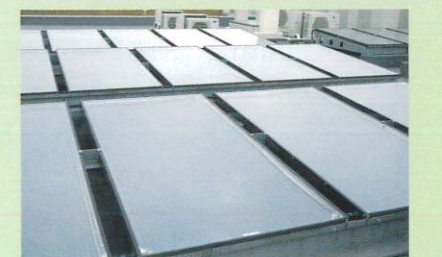
4階屋上 太陽熱給湯パネル